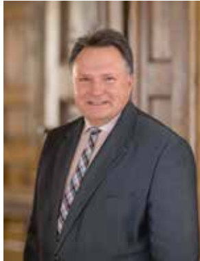
Stefan Bosse Oberbürgermeister der Stadt Kaufbeuren

Erstmals ist der Bayerische Musikschultag zu Gast in Kaufbeuren. Das Jahr 2020 wurde mit Bedacht gewählt: In diesem Jahr blicken wir zurück auf 100 Jahre Sing- und Musikschule in Kaufbeuren und zugleich auf das 50-jährige Bestehen des Verbandes Bayerischer Sing- und Musikschulen e. V.